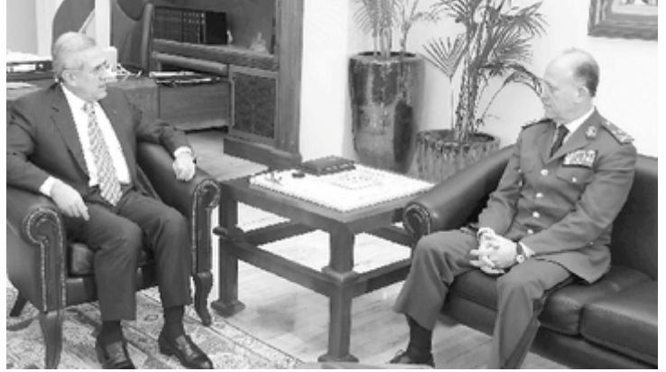
سليمان مستقبلاً ريفي

واطلع من المدير العام لقوى الامن الداخلي اللواء اشرف ريفي على الوضع الامني وتفاصيل حادثة الشغب التي حصلت في سجن رومية امس بالإضافة الى شؤون مؤسسة قوى الامن واحتياجاتها.