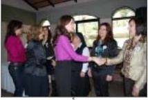
غداء لجنة أهالي المدرسة الأنطونية زغرنا 3/10/2010 number of pictures: 58